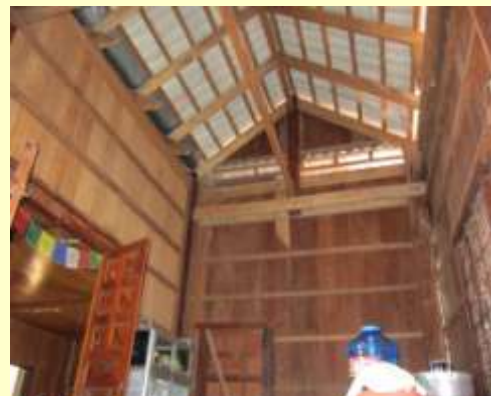
【キッチン】こうもり&ねずみの…