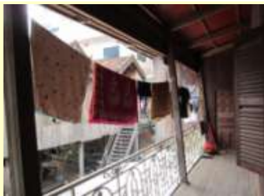
【ベランダ】洗濯物干場