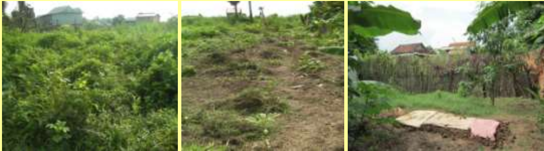
ん～畑になるのかなぁ…!? やっと地面が見えてきた!! 種まき中…大きくなあれ!!

今、配属先の幼稚園が雨季休みで休暇中のため、時間がたっぷり。そこで前々からやりたかった畑作りを始めました。耕せるようになるまで7日間。毎日草刈りと石を除く作業…そして沼地であるため、足が…。本当に畑にできるのか？と初日は心配でしたが、毎日作業を続けていると、その土地に愛着がわいてきました。今は、別の場所に種を植えて、苗になるのを待っています。苗を植える日が楽しみです！！