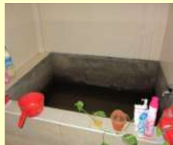
【浴室】桶に汲んで水浴び